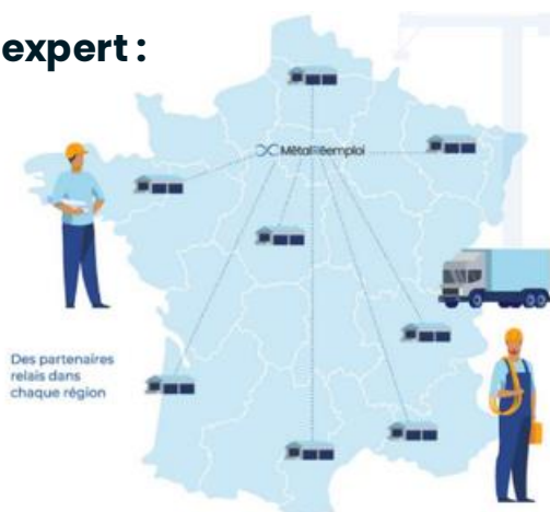
Des partenaires relais dans chaque région